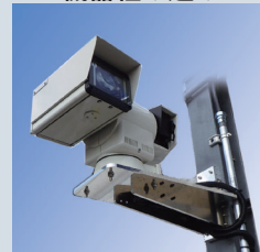
敷地内のガス漏れ 常時監視