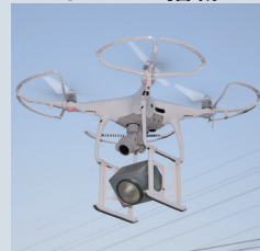
上空からの ガス漏れ検査