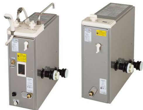
(現行品のバランス型ふろがま例)

当社は、社団法人日本ガス石油機器工業会と日本ガス体エネルギー普及促進協議会と連携し、業界を挙げた安全高度化に向け、引き続き安全型ガス機器の開発・普及を進めてまいります。